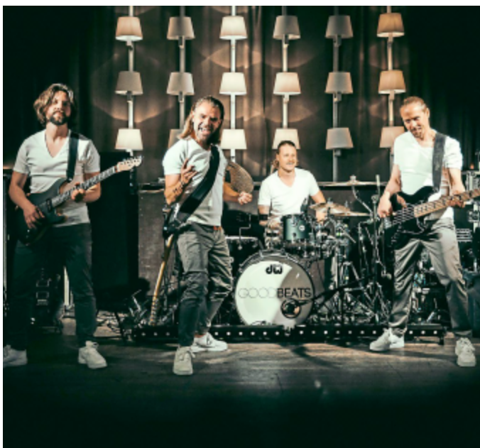
Stellen ihr neues Programm vor: die Goodbeats.

Daran schließt sich das jährliche Highlight zum Frühlingsfest an: Die bekanntesten und sehr beliebten Goodbeats präsentieren ab 20.30 Uhr auf der Marktplatz-Bühne ihr neues Programm, mit dem sie in der Sommerzeit bundesweit touren werden. Die Goodbeats zählen zu den gefragtesten Event- und Partybands.