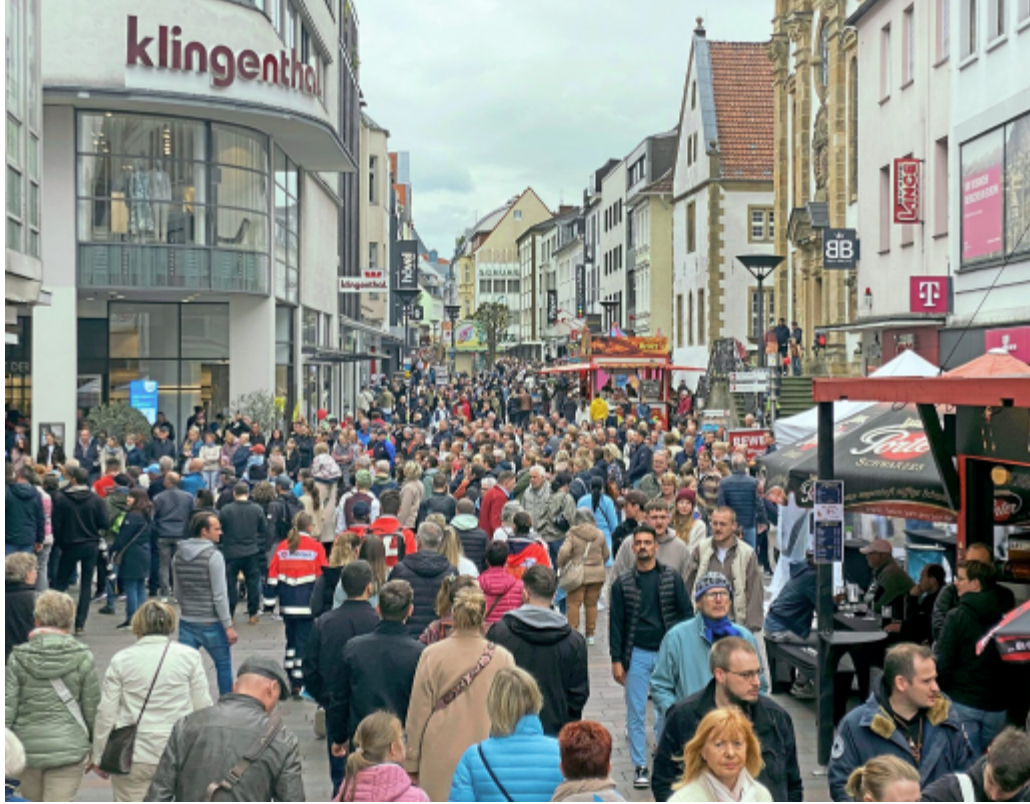
Eine volle Innenstadt – wie hier am verkaufsoffenen Sonntag zum Frühlingsfest 2024 belegt: Paderborn ist und bleibt ein Anziehungspunkt.

In Paderborn sieht die Lage aber anders aus: „Ja, Galeria Kaufhof ist weg, aber das Gebäude wird sinnvoll umgebaut und bleibt kein leeres Denkmal vergangener Zeiten“, erklärt Uwe Seibel. Statt einer Welle an Leerständen gibt es in Paderborn eher eine Fluktuation, bei der neue Läden nachrücken. „Und wenn eine Immobilie doch mal länger ungenutzt bleibt, gibt es dafür gute Gründe, die nicht zwingend mit mangelnder Attraktivität der Innenstadt zusammenhängen“, fügt er hinzu.