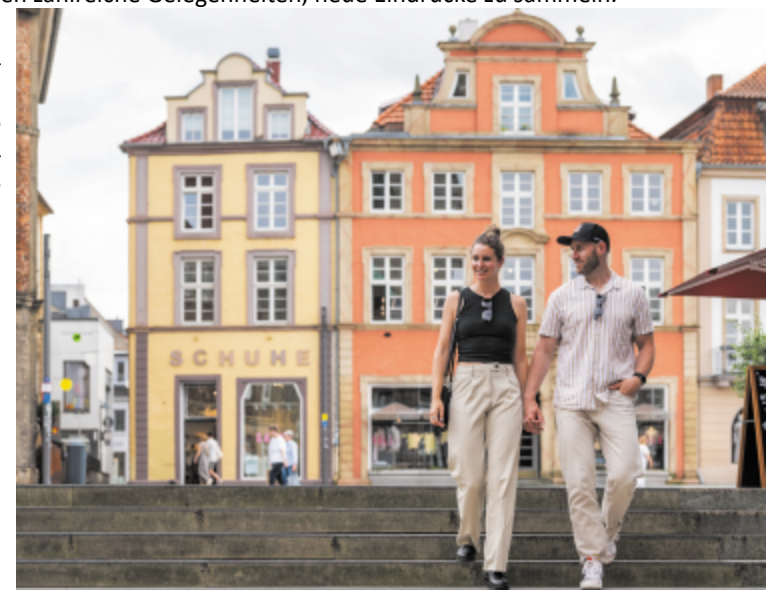
VVP e.V. / D. Ketz