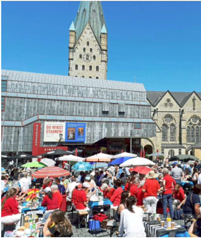
Beim Paderbrunch 2023 sorgte bestes Wetter für gute Laune. 2024 fiel die Veranstaltung wegen schlechten Wetter aus.