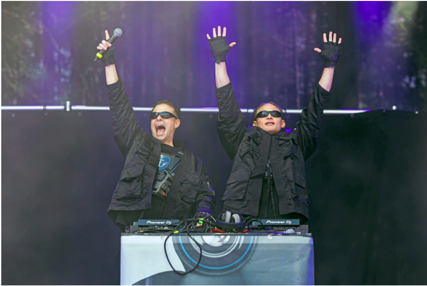
Twocolors sind die Headliner beim Frühlingsfest in Paderborn.