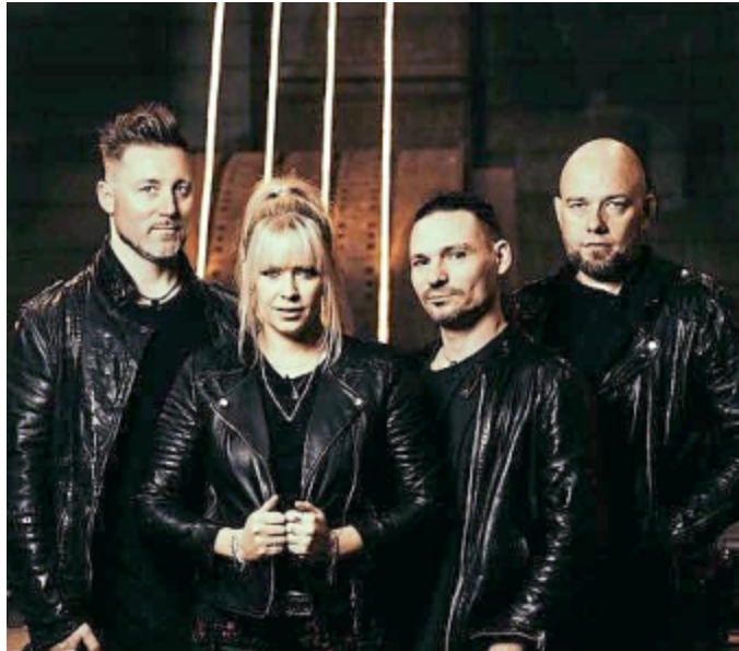
Die Lärmer waren früher als Luxuslärm bekannt.