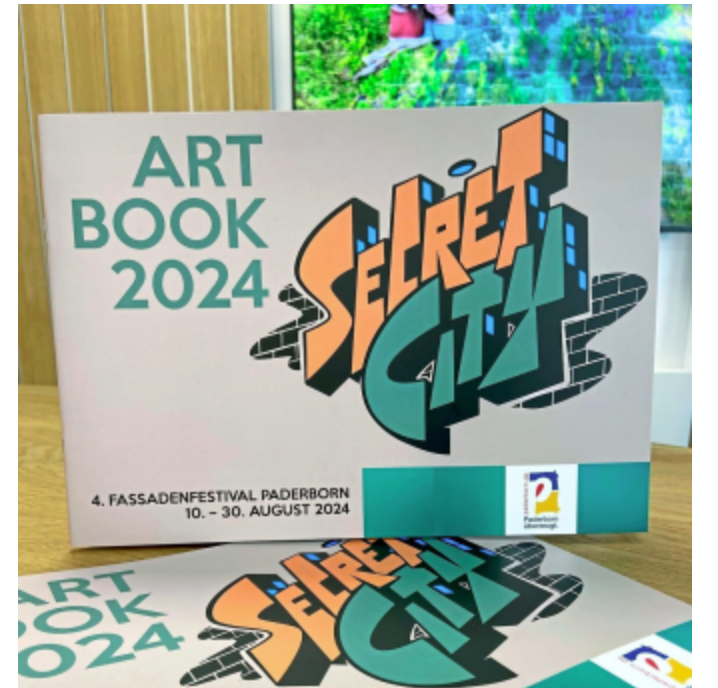
Das Art Book 2024 ist jetzt in der Tourismus Information am Königsplatz erhältlich.

Also schnell ein Exemplar sichern und sich von den kunstvollen Impressionen inspirieren lassen.