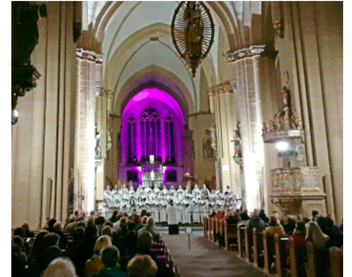
Die Lange Nacht der Kirchen der Werbegemeinschaft Paderborn zieht jährlich zahlreiche Interessierte an.

Eine Woche später - am 13. September - gibt es in Kooperation mit der Paderborner Dommusik die Lange Nacht der Kirchen. Sakrale Räume werden zu Orten, in denen Besucher er-