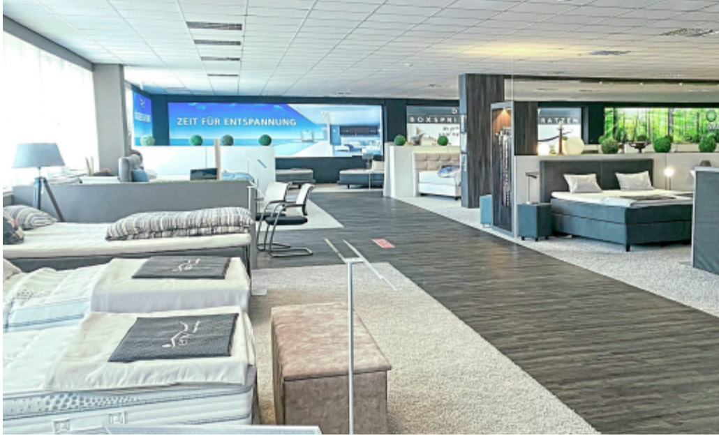
Der Boxspring- und Matratzenhersteller enjoy schlafsysteme präsentiert in seinem Werksverkauf hochwertige Kollektionen erstklassiger Boxspringbetten, Matratzen und Zubehör.