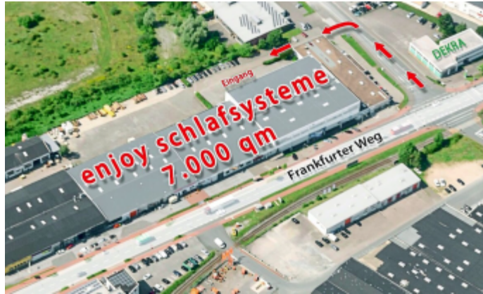
Im Werksverkauf am Frankfurter Weg 54-58 bietet enjoy höchste Kompetenz und beste Konditionen ab Werk.

Endverbraucher profitieren von unschlagbaren Preisen und exklusiven Konditionen direkt ab Werk. Sparen Sie dabei zwischen 55 und 70 Prozent gegenüber der unverbindlichen Preisempfehlung – ganz ohne den Umweg über den Zwischenhandel. Nutzen Sie die Gelegenheit